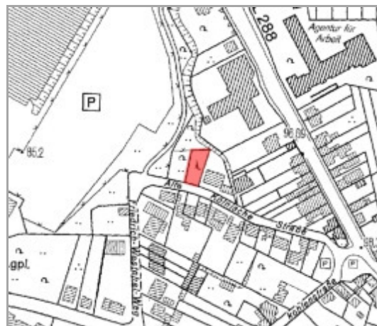
DGK 5

Hinweis: Alle Angaben sind ohne Gewähr. Durch die Aufnahme des Grundstücks in die Baulückenbörse können keine planungs- oder bauordnungsrechtlichen Ansprüche abgeleitet werden. Eine Bebaubarkeit kann verbindlich nur über eine Bauvoranfrage oder einen Bauantrag für ein konkretes Vorhaben geklärt werden.