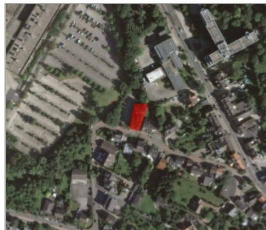
Luftbild Bergisch Gladbach