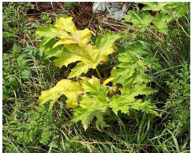
8 Tage nach dem Streichen, Foto: Frank Reichel