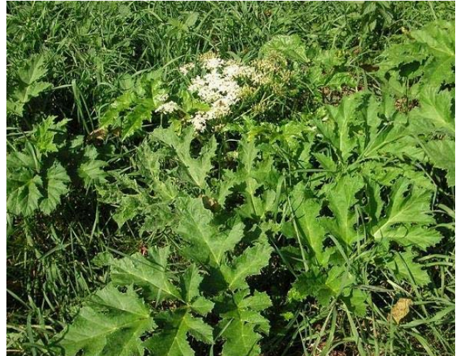
Kaum sichtbare Notblüte nach der dritten Mahd der Wiese