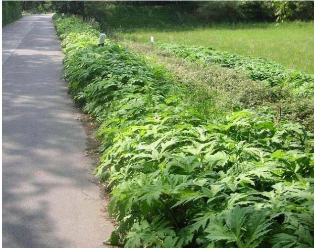
Ausbreitung trotz zweimaliger Mahd pro Jahr im Ruhrtal bei Witten