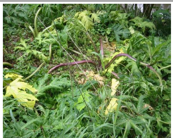
Typische Symptome 1-2 Wochen nach Triclopyr-Behandlung

Da es sich um einen Wuchsstoff handelt, dauert es etwas länger, bis man eine deutliche Wirkung sieht. Die Pflanze wächst noch einige Zeit weiter und bleibt dabei grün. Die älteren Blätter biegen sich etwas zum Boden und der Neuaustrieb wächst verdreht und aus dem Herz heraus. Bis ältere Pflanzen absterben können 4 Wochen vergehen.