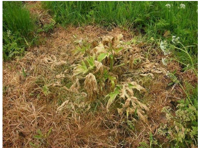
Schäden in der Grasnarbe durch Spritzen von Glyphosat, Foto: Frank Reichel

Bei vorhandener Grasnarbe muss dieser Wirkstoff besonders gezielt eingesetzt werden, da schon wenige Tropfen die umliegenden Gräser schädigen und damit Platz und Licht für am Boden liegende Samen schaffen.