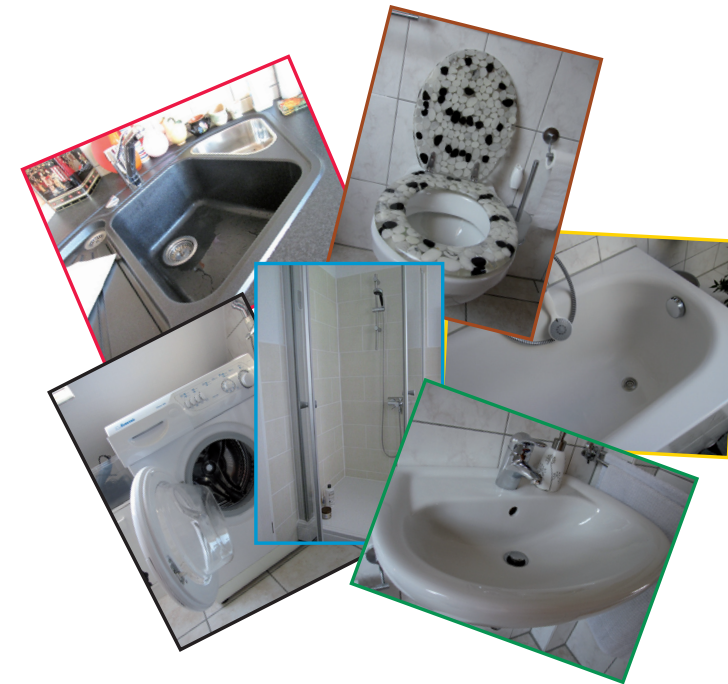
Bilder, Texte: Pia Jope / Ilka Pahlke FB 7-68 ; Layout: Thurm Design, Peter Schiffer FB 7-68