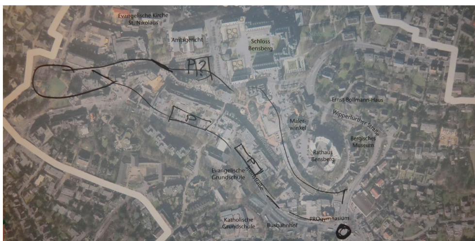
Abgrenzung des Stadtteilzentrums Bensberg nach Abstimmung mit den Experten

Im Weiteren sind alle Beiträge thematisch sortiert tabellarisch erfasst. Dabei wurden ohne Wertung auch widersprüchliche Aussagen/Meinungen protokolliert.