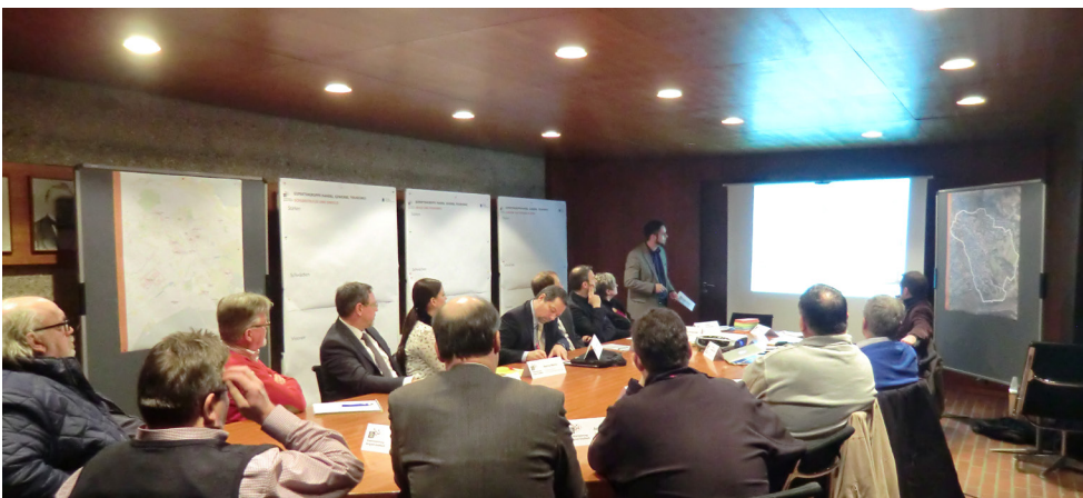
Teilnehmerkreis Expertenworkshop »Handel, Gewerbe und Tourismus« am 26. Januar 2016

Da der Expertenworkshop u.a. das Ziel hat, die Teilnehmerinnen und Teilnehmer über das Planungs-instrument InHK zu informieren, wird dieses kurz erläutert. Hierbei wird insbesondere auf seine ressortübergreifende Funktion und auf seine Bedeutung für die Akquise von Städtebaufördermitteln hingewiesen. Das Untersuchungsgebiet des InHK Bensberg wird anhand eines Plans vorgestellt. Als funktional zusammenhängend wird ein Teilraum von Bensberg und Bockenberg angesehen. Dieser umfasst im Wesentlichen die Schloß- und Steinstraße, das Rathaus- und Schlossumfeld, das Offermangelände, den Wohnpark Bensberg, die Thomas-Morus-Akademie und den Stadtgarten sowie die Verbindungen zwischen diesen Flächen.