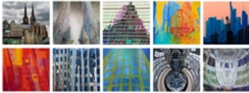
Ausstellung „STADT-ANSICHTEN“ Birgit Voos-Kaufmann - Malerei Wolfgang Hundhausen - Fotografie