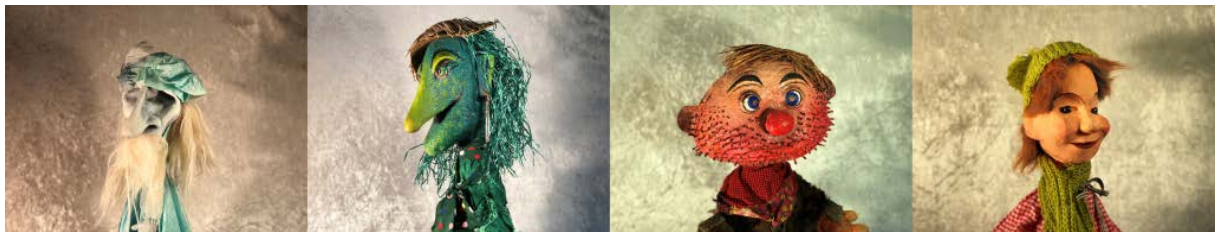
Handpuppen aus der Sammlung Gerd J. Pohl

Sehr geehrte Damen und Herren, herzlich willkommen zur September-Ausgabe unserer Kulturnachrichten.