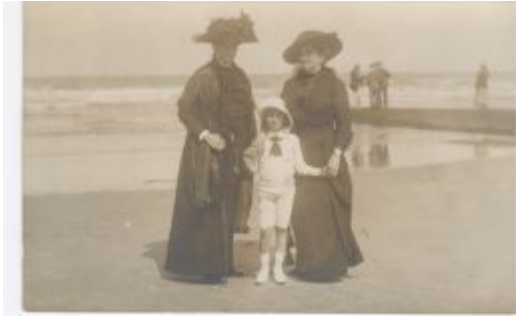
..... Eine Reise ans Meer um 1900.